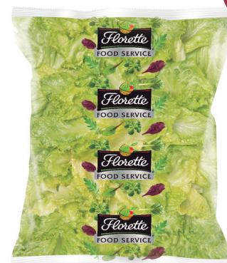
ICEBERG Corte 40mm