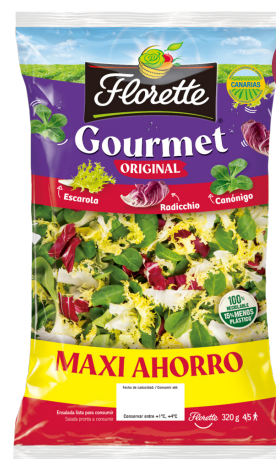
MÉZCLUM ORIGINAL Escarola rizada, radicchio, brote de lechuga roja y brote de espinaca