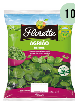
BROTOS DE ESPINACA