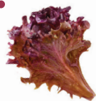
Brote de Lollo rojo